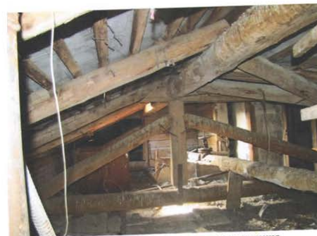
Фото №22. Общий вид чердачного помещения.