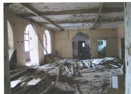
Фото №12. Общий вид помещения 1-го этажа в осях 5-6/В-Д. Деревянное перекрытие усилено металлическими балками.