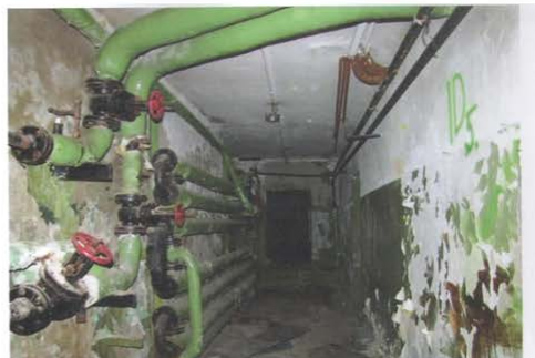
Фото №23. Общий вид подвального помещения в осях А-Б.