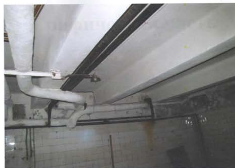
Фото №24. Общий вид перекрытия подвала в осях Б-В/4-7.