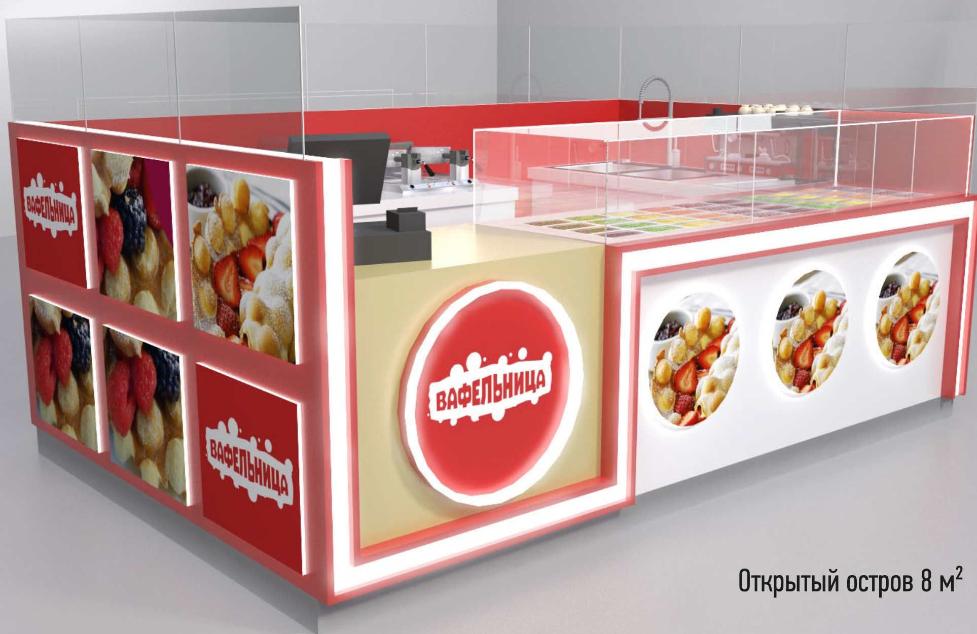
Открытый остров 8 м 2