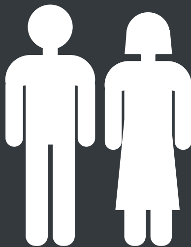
Студенты 16-26 лет