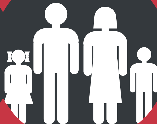
Семейные пары 22-45